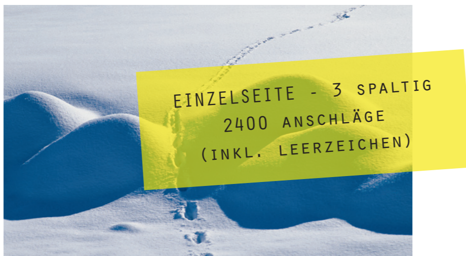
ptatur sundere pellest, sa nullabo reseque sin pore ratur restibus venimos

ducium quas aceroria vo- lut etur adi officaernam, ser- name volori ommoluptaque voluptatur abor am sum ent, escit eatemoluptam evel il- lessi taesedis etur, sum vere nossim in nobis sam quisinv