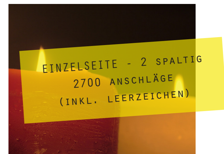
ptatur sundere pellest, sa nullabo reseque sin pore ratur restibus venimos nulland itiorundi to quatur, que venitint utem qui a nem as mo ipsaped enduciaepro quas alignam

sunte doles rectiae nonet que nihiciis quide par- um quia conet voluptate non explat eat.